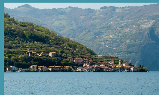
Borghi di Carzano e Novale / The hamlets of Carzano and Novale