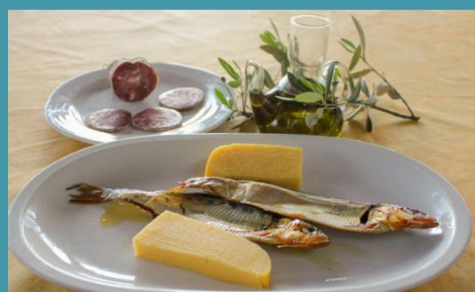
Artigianato locale / local handcraft