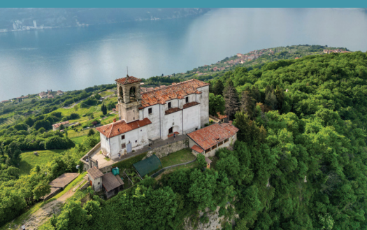
Santuario Madonna della Ceriola / Madonna della Ceriola Shrine